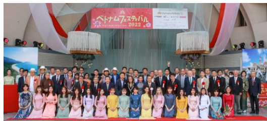
昨年の代々木でのベトナムフェスティバル・開会式の様子