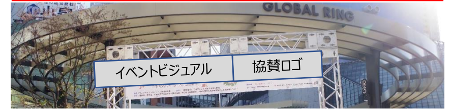
パンフレット (A4 2つ折り)