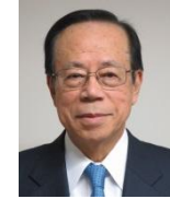
最高顧問 福田康夫 元内閣総理大臣