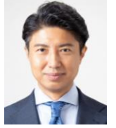
共同委員長 青柳陽一郎 衆議院議員