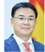
実行委員長 ファムクアンヒエウ 駐日ベトナム大使